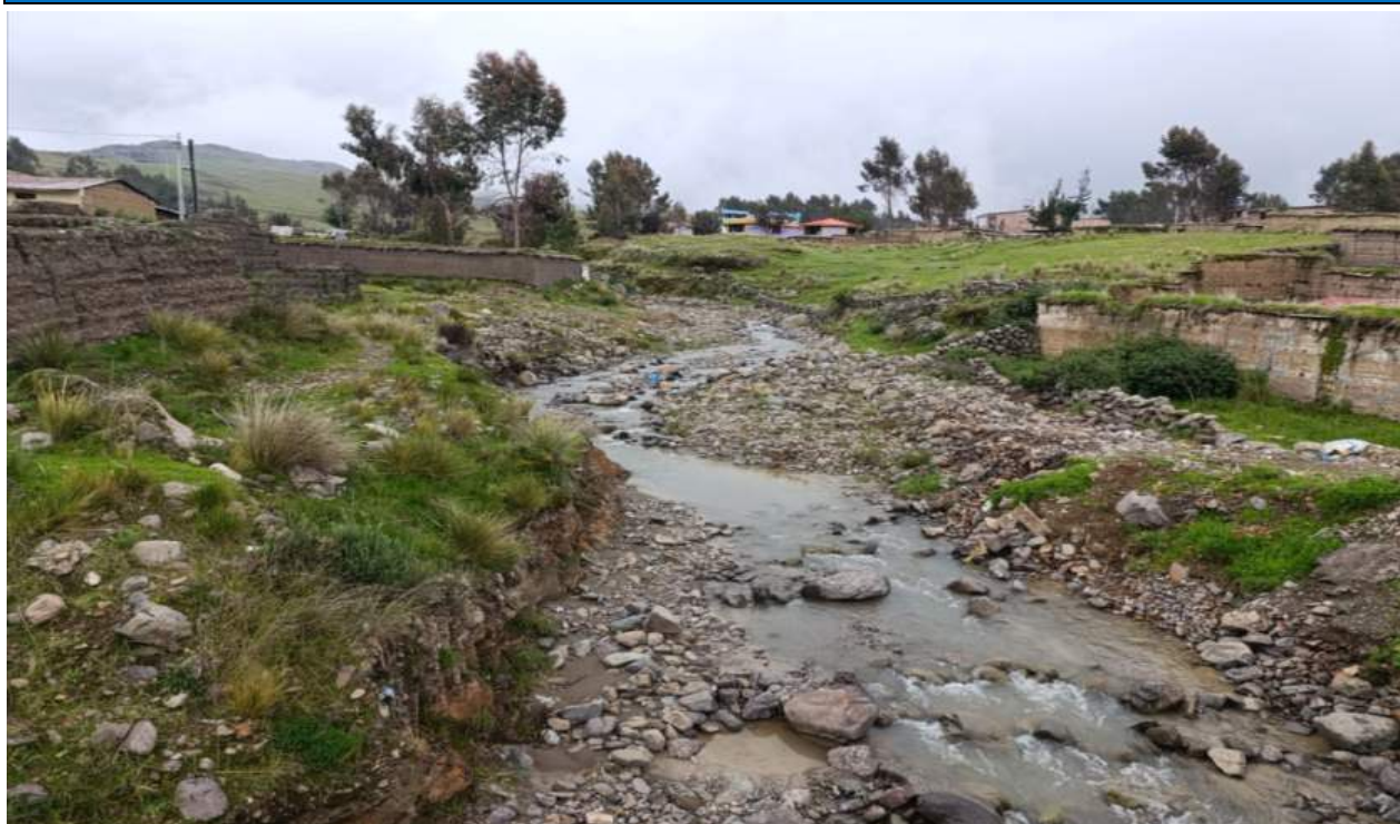
FIGURA N° 01: TRAMO CRÍTICO EN EL RIO FLORIDO, CERCADO, DISTRITO DE CASTROVIRREYNA, PROVINCIA CASTROVIRREYNA, NOTESE EL CAUCE COLMATADO