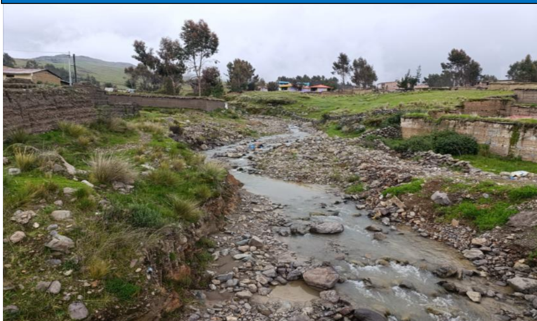
FIGURA N° 01: TRAMO CRÍTICO EN EL RIO FLORIDO, CERCADO, DISTRITO DE CASTROVIRREYNA.