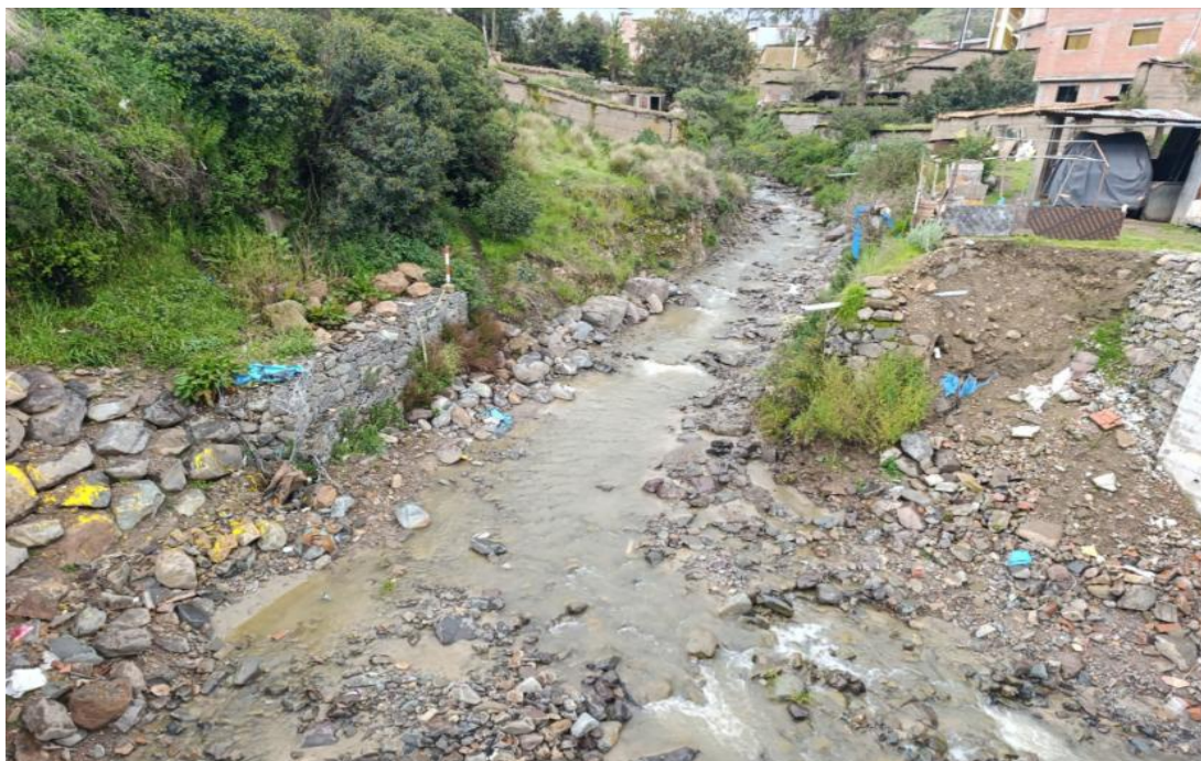
FIGURA N°02: VISTA DE GAVIÓN SOCAVADO EN LA MARGEN DERECHA DEL RIO FLORIDO, ALREDEDOR SE ENCUENTRAN LAS VIVIENDAS DEL CERCADO DE CASTROVIRREYNA.